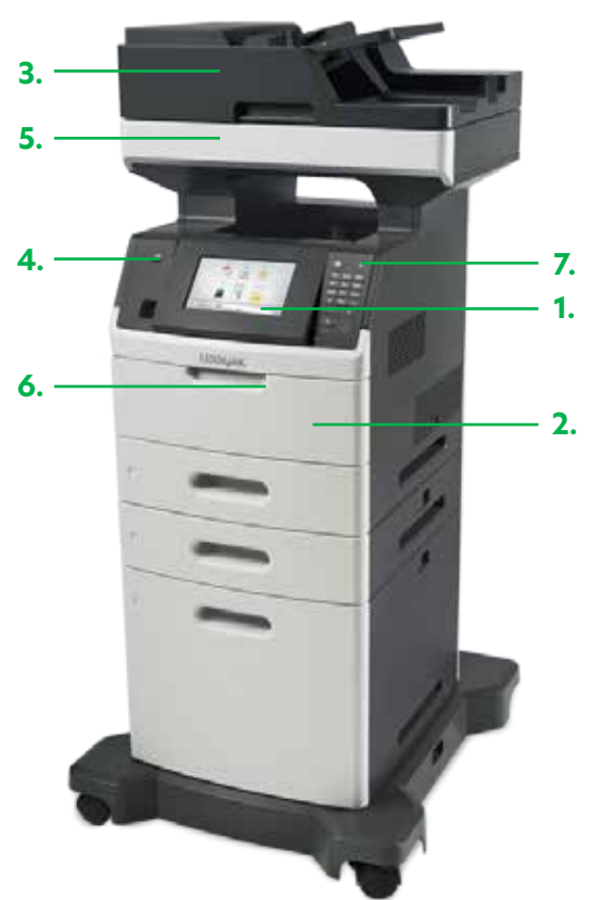
XM5163-Modell mit 550-Blatt-Zuführung, 2.100-Blatt-Zuführung und Basis mit Rollen

Innovative Tonertechnologie für konstant hohe Bildqualität – ganz ohne „Schütteln“.